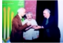
در زمینه پوستر کتاب، کودک و خانواده