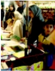
از حیث تطابق محتوا و صورت آنها با اصول تربیتی اسلام انجام دهد.

میزی کتاب کودک، به طور مشخص از دهه شصت به بعد شروع شد و تنها همکار و ضابطه موجود، معصومه شورای عالی انقلاب فرهنگی در سال ۶۷ است که طبق آن وزارت فرهنگ و ارشاد اسلامی موظف شده است با تشکیل هیأت نظارت بر انتشار کتاب‌های کودکان، کار نظارت بر کتاب‌های کودک و نوجوان را