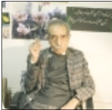
و آن کلاس ما هستم.

شیدم که آقای دکتر ویلسون یشاک، زبان‌شناس صهری قبلی اصلی آمریکا یایی شده. در س صدن آن است که توری چاسکی را بر زبان عربی متعلق نماید. به کلاس ایشان هم رفتم. ولی در آنجا هم چیزی ندیدم. گفتم: پس لطفا توری چاسکی را بر زبان عربی کو؟ گفتند: داریم روی آن کار می‌کنیم. زبان‌ارین دیگر کردم هر چه خودم را در رشته‌های مختلف از زبان‌شناسی قوی‌تر کنم. به جواب سوال‌ها یم بهتر خواهم رسید. اما نشوره این همه آموختن و کلاس رفتن چه بود؟ آنها تاثر خود را بر من گذاشتند. از آن پس نامروز نامه این همه رنج آموختن دقت و وسواس گونه‌ای بر روی زبان نوره است. دقت بر همه عناصر زبان، بر روی هر جمله‌ای که از دهان افراد بیرون می‌آید، به حرف دیگران گوش می‌دهم. اما هم به وقت، اما در سخن پاک، حلق و ویژگی منگنه من شده‌است و آن وقت در کلمات ادا شده و نوع استفاده از کلمات است. این در من یک طبیعت تألیفه شده‌است که به درستی کلمات و وصلات افراد دقت کنم. من این وسواسی و دقت را مایلون آن درسی‌ها