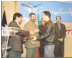
با انتخاب برترین آثار رسانه ای