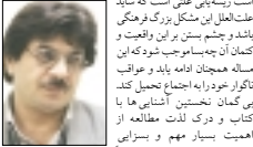
کتاب و پدیدآورندگان رتبه‌بندی

می‌توان در کنار هر درس، لحظاتی را به نقل خاطرات و دریافته‌های دانش‌آموزان از مطالعه، بهترین و با تاز و ترین کتاب‌هایی که خوانده‌اند اختصاص داد و می‌توان در همین کلاس‌ها و مدارس درگترگونی‌های بسیاری پیدا کرد و یقناً اگر در همین عرصه سرمایه‌گذاری هوشمندانه‌ای صورت یابد، در آینده‌ای نه‌چندان دور شاهد نتایج امیدبخش عوامهم بود و مطمئن‌تر حکم می‌کند که اگر آب چشمه‌ای گل‌آلود به نظر می‌آید باید علت او را در سرچشمه جست‌وجو کرد. توسعه کتابخانه‌ها نیز امری است که با توجه به آمار و ارقام فعلی و در مقایسه با استانداردهای جهانی نیازمند توجه جدی است. در حال حاضر تقریباً هفتاد درصد مدارس کشور فاقد کتابخانه است و نسبت کل جمعیت به کتابخانه‌ها تقریباً یک پنجم حد استاندارد جهانی و دیگر نسبت‌ها نیز به همین منوال جای بحث و تکراری دارد و حتماً که پس از گذشت سال‌ها هنوز فکری در این خصوص که بسیار دبهی می‌نماید، صورت نپذیرفته است.