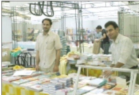
برای سرمایه‌گذاری بهتر و بیشتر برای نمایشگاه کتاب سال آینده اعلام کرد.