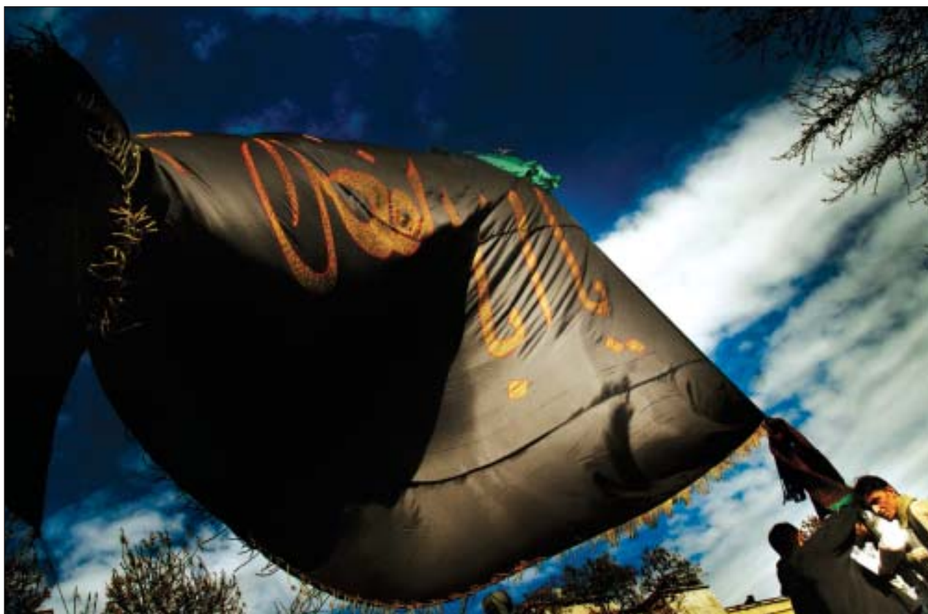
عکس: گزارش لاجورد